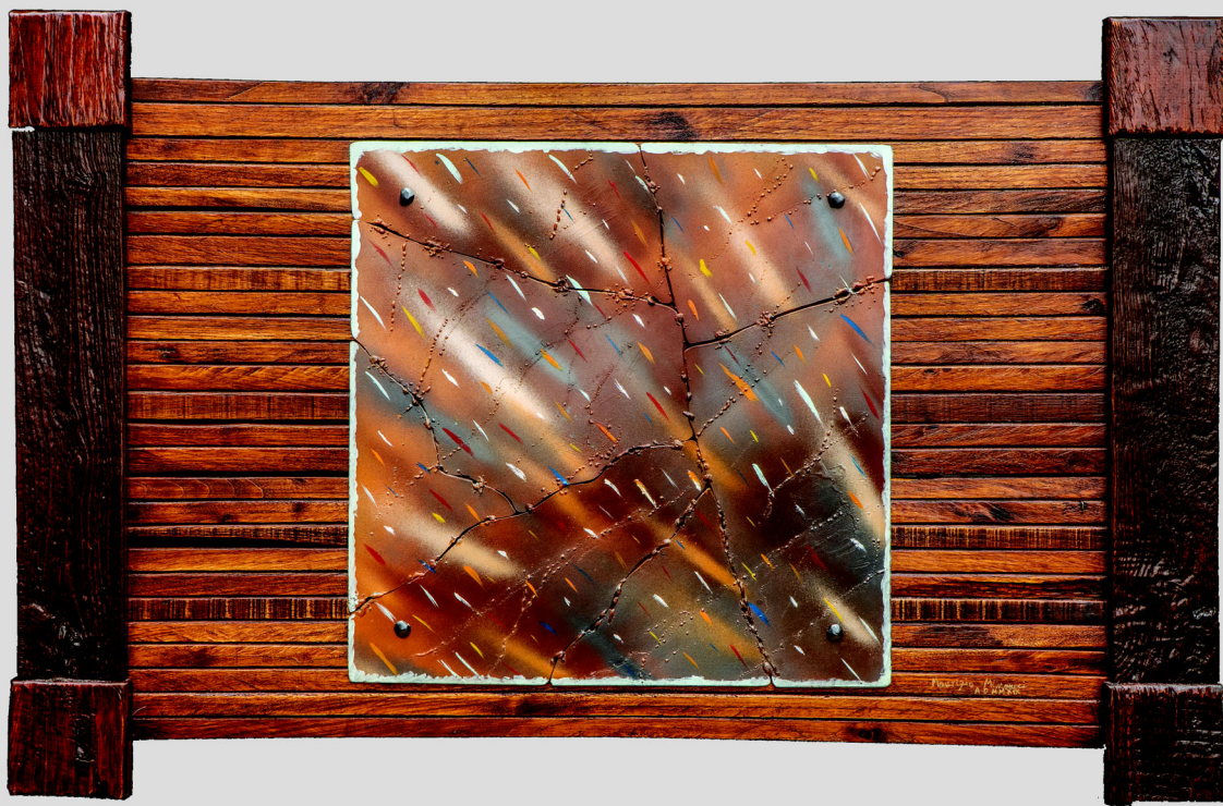
Bolidi Cursòri in una Notte di Ferro - 110 x 72 cm - 2020