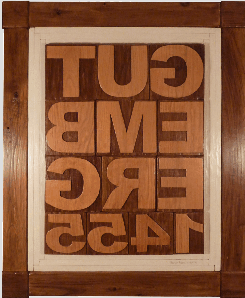
Gutenberg 1455 - 99 x 119 cm - 2021