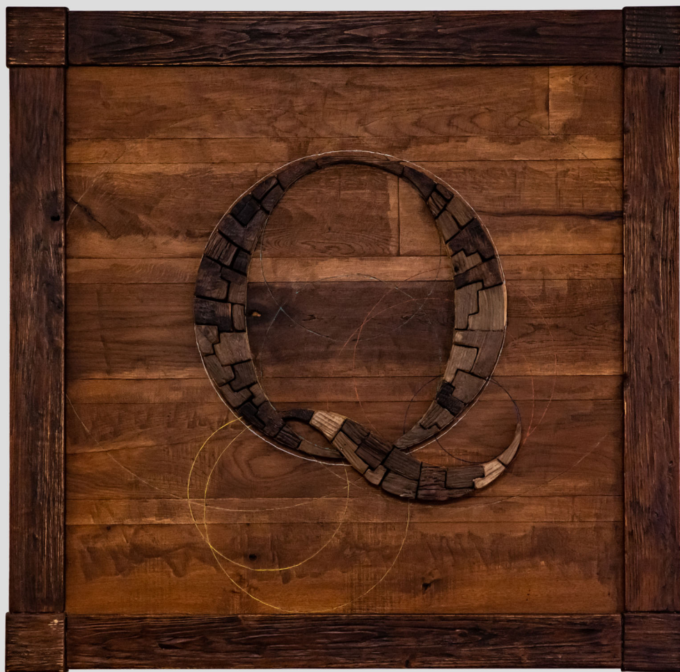
Monogramma Q - 120 x 120 cm - 2018