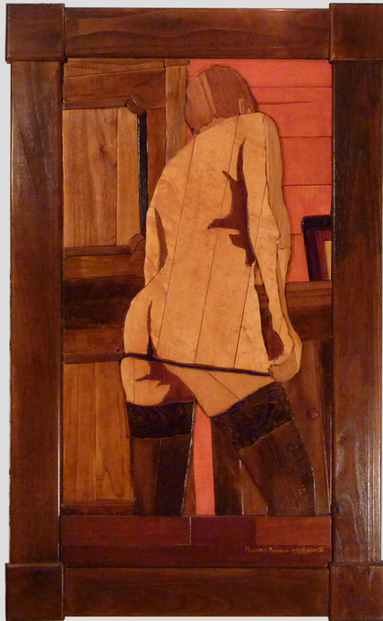
L'Amante Svogliata - 70 x 114 cm - 2016