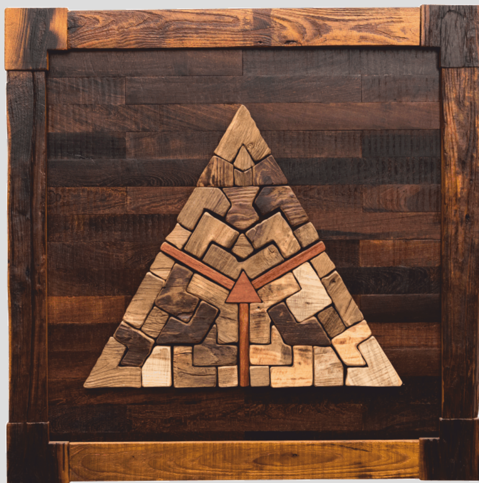
Triticus Universi: La Compiutezza - 120 x 120 cm - 2018