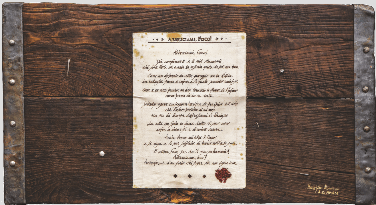
Palcoscenico Vòto per Matera e Parole - 98 x 53 cm - 2021