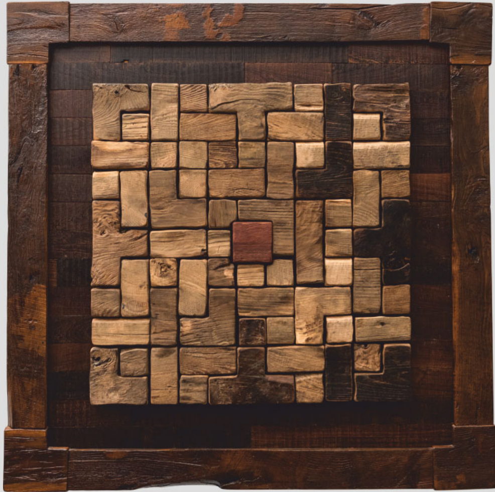
Triticus Universi: Il Divenire - 120 x 120 cm - 2018