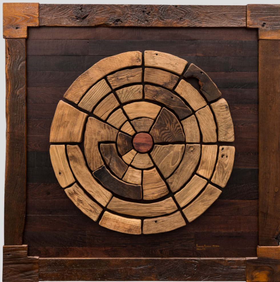
Triticus Universi: Il Caos Primordiale - 120 x 120 cm - 2018