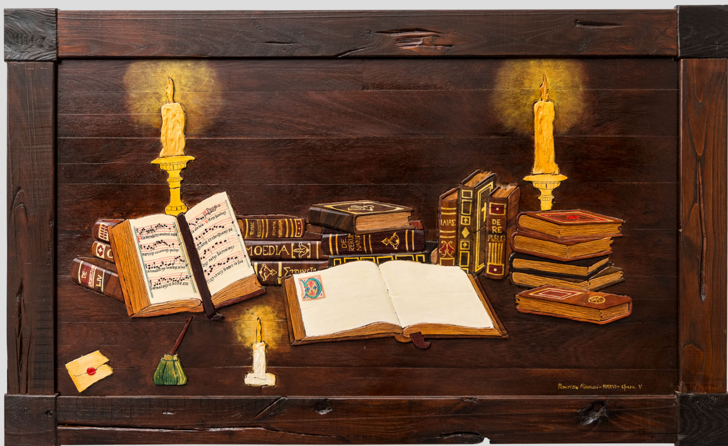
La Sublime Biblioteca - 149 x 92 cm - 2016