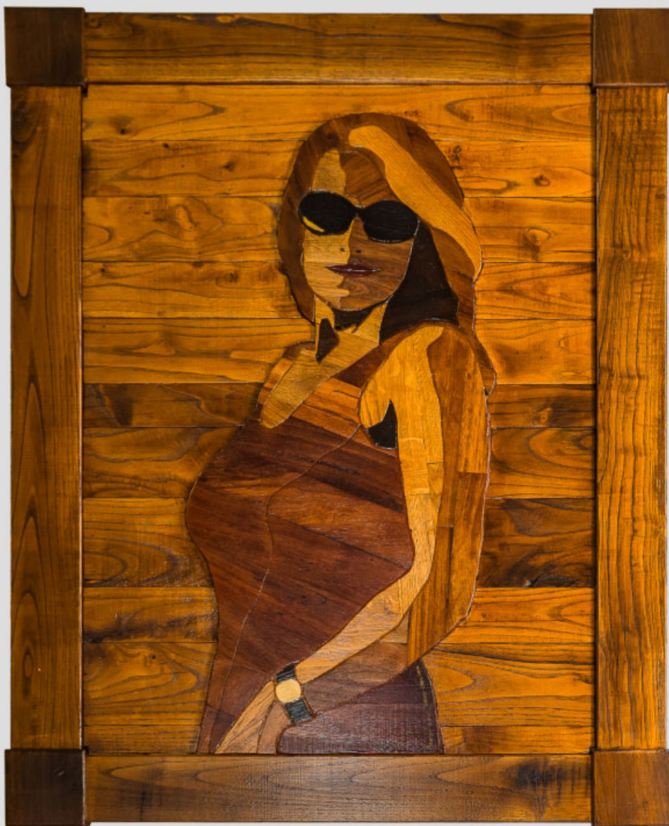
Ritratto di Donna Anna - 98 x 125 cm - 2016